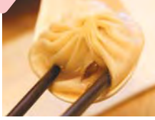
昼食は人気店「鼎泰豊」の小籠包!世界中の食通をうならせた「幻の小籠包」のあまりの美味しさに1人5個のところ、Y社長&スタッフMは同じテーブルのメンバーが食べ切れなかった分を分けてもらい、10個近くをペロリと完食!そのうえ、店を出たら目の前に香ばしい香りを漂わせる屋台を発見、もちろん買いました台湾のスイーツ菓子。