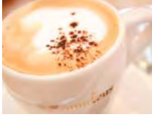
世界一の高層ビル「台北101」でお買い物。ショッピングモールを散策後は、またまたお茶タイム。