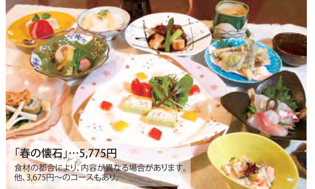
「春の懐石」…5,775円 食材の都合により、内容が異なる場合があります。他、3,675円～のコースもあり。

少しずつ春風が心地よくあたたかな光が感じられる頃。今旬も「かど菊」においしさと美しさを盛り込んだ、春を告げる11品がそろいました。豊かな色合いの奏でる「ハーモニー」が魅力の前菜「海老とサフランのテリーヌ」は、海老や枝豆の甘みに粒黒ベツバドレッシングのさわやかな刺激が魅力の「ほんのりと春が咲くひと皿」。まさに、ひとつの素材だけでは決して生まれない味わいと香りです。桜の薄紅色に野山の緑があふれ、喜びの席にはびつたりの「春の懐石」をぜひ、家族や大切な人と楽しんでください。