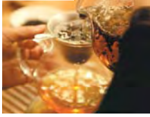
辛亥革命や対日抗戦などを命を落とした約33万人の軍人を祀る「忠烈祠」。表情を変えず全く動くことなく建物を守り、1時間毎に交代式が行われる(まるで人形!)。その後、茶室で中国茶の入れ方について勉強。