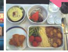
台北に到着!スタッフ3人も初の台北だけに、バスから見える町並みに釘付け!まずは、台湾家庭料理のウエルカムディナー。台湾のビールはあっさり口当たりがよい。