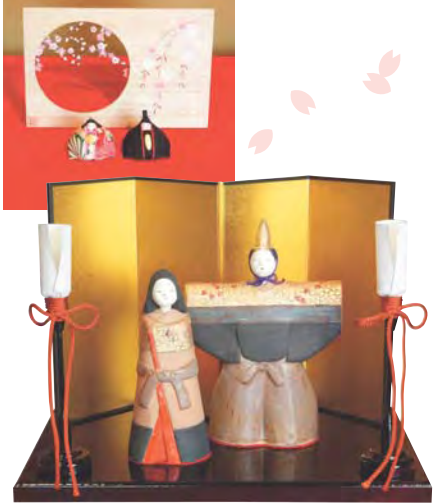
立雛セット (作家「杉野圭子」)