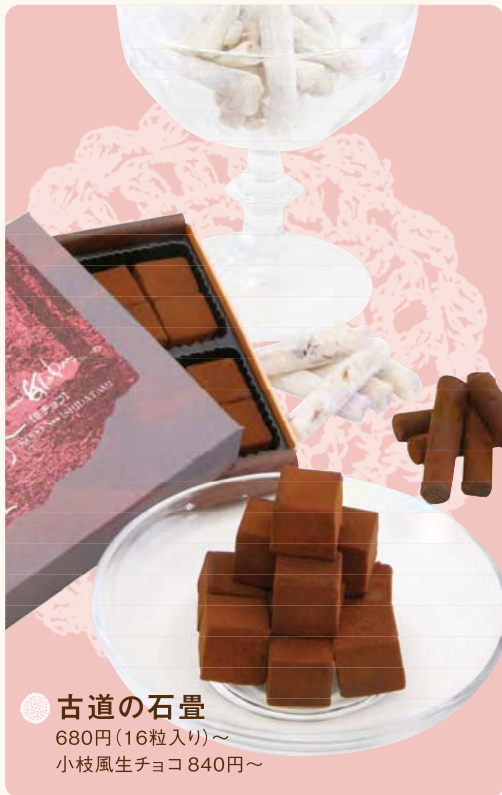
● 古道の石畳 680円 (16粒入り)〜 小枝風生チョコ 840円〜

ケーキハウス グリューボン 上富田町朝来(国道沿い) ☎0739-47-4122 AM9:00~PM8:30