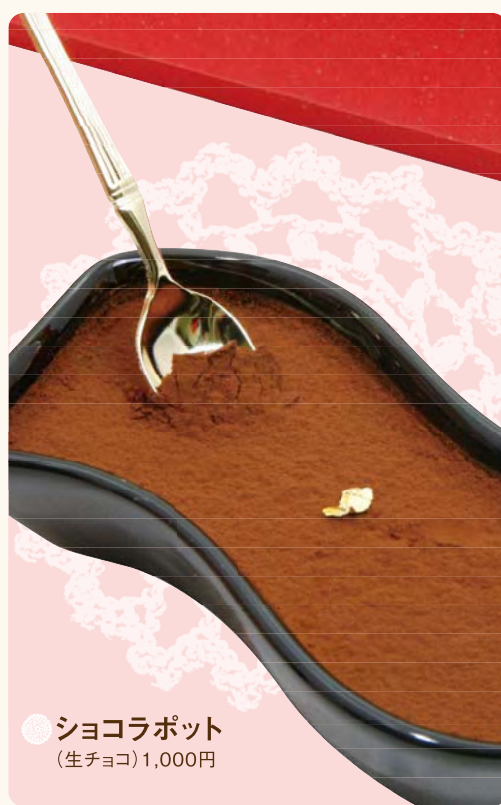
● ショコラポット (生チョコ) 1,000円

濃厚なカカオの香りが広がる、しっとりやわらかな生チョコを陶器に流し込んだ「ショコラポット」。美味しいだけでなく、真っ赤なパッケージの中に幸せを呼ぶ金のスプーンと一緒にセットされた他では手に入らない一品! 数に限りがあるうえ予約のみとなっているので、今すぐの予約がおすすめ! 他にも、イチゴで可愛らしくデコレーションされた「V・D 特製ケーキ」も予約受付中!