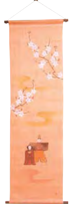
たべすてり「桃花雛」

平安の時代から続く女の子の健やかな成長と幸せを願う大切な桃の節句「雛祭り」は、日本の行事のなかでも華やかな春のほほえみのひとときです。和楽屋に、今年も現代の生活に沿った飾り方を生かすことのできる、温かみのある信楽焼、彩り鮮やかな古布やちりめんで作られた雛人形が豊富に揃いました。ころんと丸い形をした愛らしいお雛さま、凛とした美しさが印象的な立雛…。それぞれの表情を眺めているだけでほっこり温かい気持ちになります。華やきの日、生活の中に溶け込ませるようにしつらえたい雛人形ばかりです。