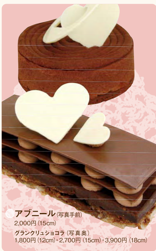
● アブニール (写真手前) 2,000円 (15cm) グランクリュショコラ (写真奥) 1,800円 (12cm) ・ 2,700円 (15cm) ・ 3,900円 (18cm)

パティスリー・マサ 田辺市神島台1-21 ☎0739-25-0055 AM10:00~PM8:00 (カフェL.O PM6:00) 水曜日 ※2月10日(水)は休まず営業