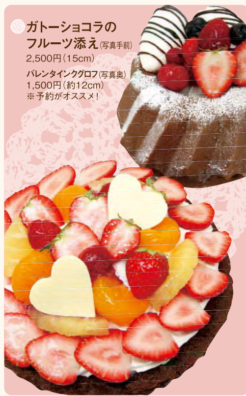
● ガトーショコラの フルーツ添え (写真手前) 2,500円 (15cm) バレンタインクゴロフ (写真奥) 1,500円 (約12cm) ※予約がオススメ!

今年のタムラはバレンタインケーキが豊富にラインナップ! いちおしは、しっとり濃厚な甘さのガトーショコラに、生クリーム&フルーツをトッピングした特製ケーキ「ガトーショコラのフルーツ添え」。美味しさもボリュームもたっぷりだから贈り物だけでなく、家族で過ごすバレンタインに嬉しい一品。もちろん店内には、2010年新作が追加された「選べるトリュフ」がズラリ!