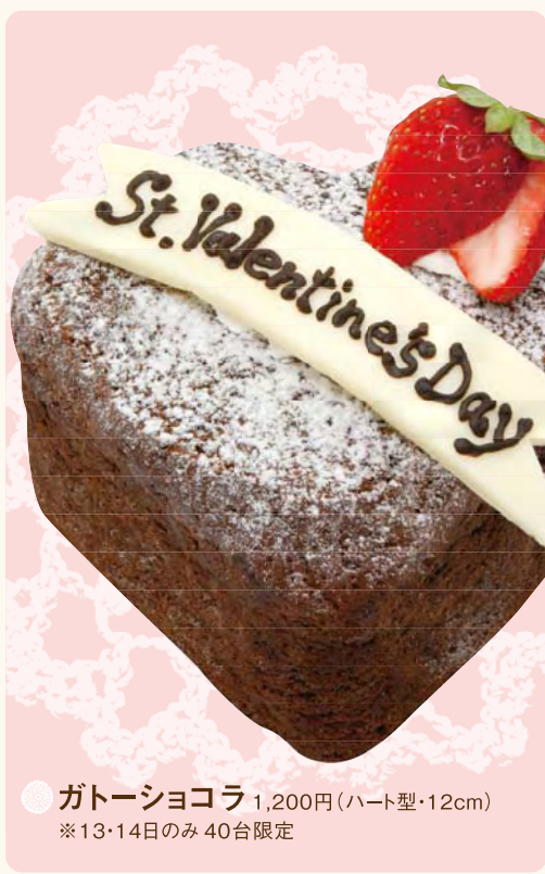
● ガトーショコラ 1,200円 (ハート型・12cm) ※13・14日のみ40台限定

菓子の蔵しんたに 田辺市宝来町15-10 ☎0739-81-0252 AM8:30~PM7:30 月1回 ※2月は25日(木)が休み