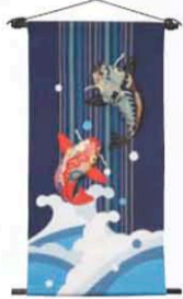
チリメンで出来た、鮮やかなタペストリー。天鰯の滝のぼり 6,825円