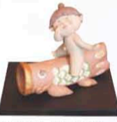
鯉にまたがった男の子がとも愛らしい。鯉のり 信楽焼 6,510円