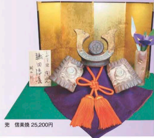
兜 信楽焼 25,200円

鯉(こい)や兜(かぶと)、刀(やいば)などを飾り段に飾り、庭にはこいのぼりを立てる。男の子の成長と健康を祈る端午の節句は、奈良時代から続くといわれる日本の風習です。和楽屋では、時代の移り変わりとともに、ライフスタイルに合わせた楽しみ方を提案してまいります。力強さと勇ましさ、存在感たっぷりの兜や、表情やしぐさが豊かな信楽焼の人形は、眺めているだけで心が和むもの。家族で楽しみ知る、日本ならではの良き文化です。ひと足早く初夏を感じさせるインテリアとしてもおすすめです。