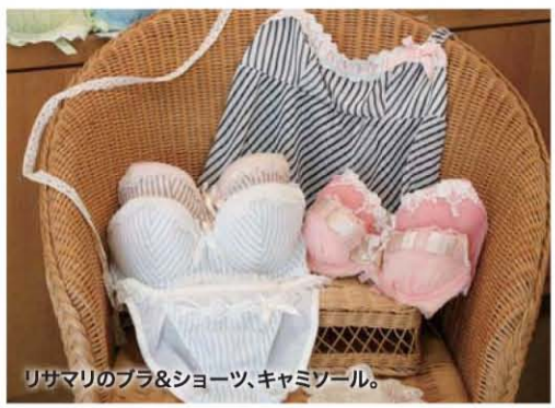
リサマリのブラ&ショーツ、キャミソール。

●お気に入りのブラが見つかったあとのサイズ決めはスタッフに相談するのがお勧め！デザインによってサイズも違ううえに、自分の思っていたサイズは実は合っていないなどなど新発見もあり。ブラ2,300円〜/ショーツ1,000円〜 私たち女性にとって下着は洋服やアクセサリーのように、選ぶことと身につけることを楽しめる隠れたおしゃれアイテム！そして、お気に入りのランジェリーを見つけた嬉し気分になれる乙女のハッピーアイテム。スイーツ本店の店内には、思わず「かわいい！」と手にとっては、あれもこれもと目移りしてしまいそうなほどのブラ&ショーツが、季節ごとに新しいデザインでラインナップ！この春のおすすめブランドはレースやリボンなどといったかわいい要素がたっぷり盛り込まれた「リサマリ」。デザイン・品質はもちろん、リーズナブルさも人気のひみつです。人気のデザインはすぐになくなってしまいますので早めにチェックして！