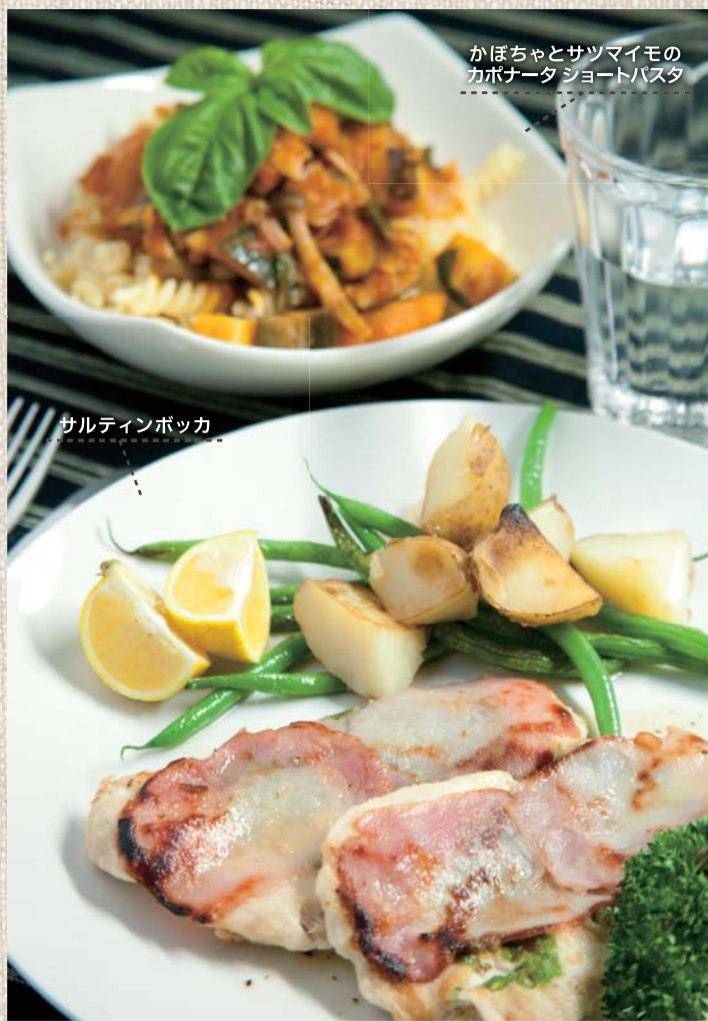
かぼちゃとサツマイモの カポナータ ショートパスタ