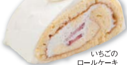
いちごの ロールケーキ …300円

「四季彩館」といえば絶対はずせない「いちごタルト」。トッピングのいちごはもちろん、さくとりとしたチーズタルトは下だけ食べてもすごくおいしい! あえて別々に食べるというリピーターさんもいるくらい。「いつも子どもにいちごをとられるの…」というママさん、このタルトなら大丈夫ですよ! また、パティシエこだわりのロールケーキは主張し過ぎない甘さが特徴で、生クリームとカスタードの絶妙な味わいには脱帽モノです!