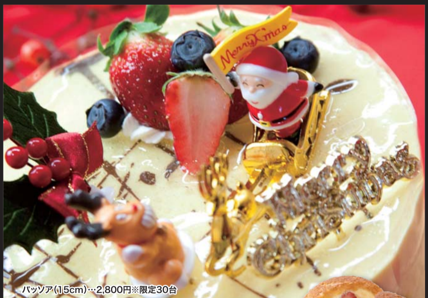
パッション(15cm)…2,800円※限定30台

●いちごのシフォンケーキ(18cm) 2,100円 ※限定30台 ●ベリーサンタショート1個 480円(当日限定販売・予約不可) ※ショートケーキの取り置きはできないので、当日早めにお買い求めください!