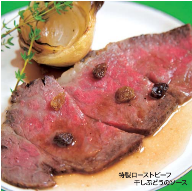
特製ローストビーフ 干しぶどうのソース

貝柱とピーズのカクテル ジェノパソスを添えて/フォアグラのソテーとチョコレート パルザミソース/カキのチャウダー/ローストチキンとマッシュルームのソース/クエと車海老のポトフ仕立て/シャベット/黒毛和牛のロースト 西洋牛蒡のフライ添え フランボワーズソースで/バラカ(幸運を呼ぶチーズ)/プッシュノエルとデザート各種(ワゴンサービス)/コーヒーと小菓子