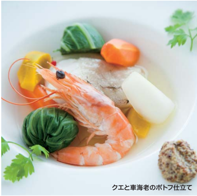
クエと車海老のポトフ仕立て