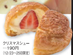
クリスマスシュー …190円 (12/23~25日限定)

定番のケーキとともに毎年クリスマス限定の新作ケーキを提案する「菓子の蔵しんたに」。今年のクリスマスには甘いケーキではなくあえてパッションの酸味をきかせたケーキがおめめです。チョコの風味とパッションの相性が抜群のパッションは後味がサッパリしていてディナーの後にピッタリ! まわりのムースの酸味と中の甘〜いチョコのコントラストは大人の味わいです。限定30台なので予約は急いで!!