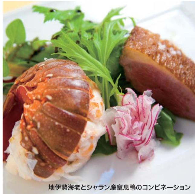
地伊勢海老とシャラン産室息鴨のコンビネーション

今年もお家X'mas派のためにPien特製三元豚スエアリブを販売! ハーフで数日マリネし低温でじっくりロースト。(100g 840円・一本180g前後、不定費) 2本以上より販売 12/15(木)まで(要予約) (店舗お渡し 12/24(土)・12/25(日) 両日とも昼以降)