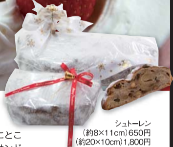
シュトーレン (約8×11cm) 650円 (約20×10cm) 1,800円

写真の生クリームケーキは風味を大切にするため鮮度にとことんこだわっています。フレッシュないちごがたっぷりサンドされているので切るのも楽しみ~! また、今年のオススメは白い砂糖に包まれたシュトーレン。発酵生地の中にごろごろナッツとドライフルーツたっぷり、スパイスをきかせたドイツの伝統菓子がクリスマスの前から少しずつスライスして食べます。日ごとに味が馴染み、おいしさがどんどん深まります!