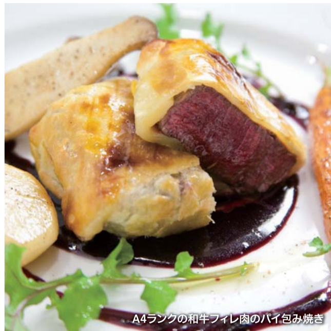
A4ランクの和牛フィレ肉のパイ包み焼き

2011クリスマスディナー "Natale" (2名様以上 要予約) お一人様 4,800円 (税込) 12/23(金)~12/25(日) カブのポターージュ / 前菜6種盛り合せ / 【パスタ】オマール海老のカネロニorホロホロ鳥と香味野菜のラグーor北海道産生ウニのクリームソース / 【メイン】クエハタのボワレorフランス産マダラ鰯のローストor熊野牛スネ肉の赤ワイン煮orA4ランクの和牛フィレ肉のパイ包み焼き / ドルチェミスト(あま王苺のムース・モンブラン・リンゴのタルト) / コーヒーor紅茶