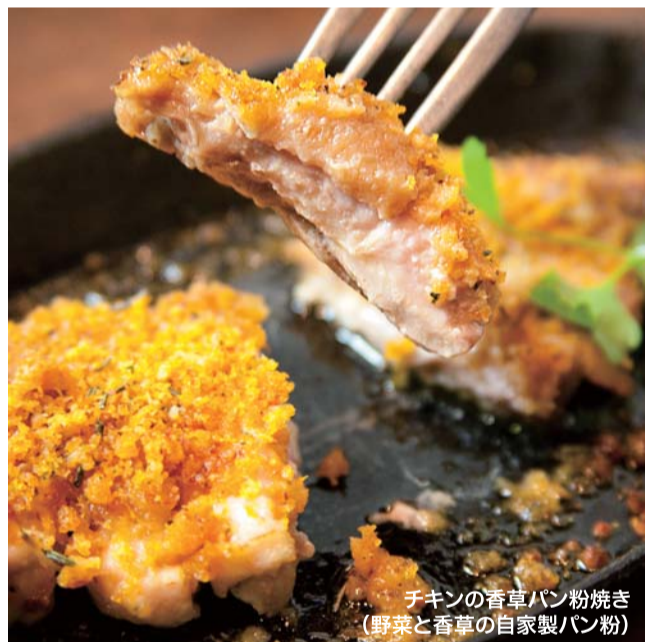
チキンの香草パン粉焼き (野菜と香草の自家製パン粉)

クリスマスディナーコース お一人様 4,000円 (税込) 12/19(月)~12/25(日) 前菜2種 / シーフードチャウターのポットパイ / 水牛モッツアレラとバジルのトマトパスタ / チキンの香草パン粉焼き(野菜と香草の自家製パン粉) / ホワイトモンブラン / コーヒー ●メインのチキンはかしわ専門店が家さんの若鶏 ●12月限定のアラカルメニュー... 海老とアボカドのジェノベーゼ 1,300円 / カラスミと水菜のバスタ 1,200円 / その他本日のオススメメニューも!