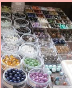
クオリティの高いパワー ストーンだけを約50種類 以上を揃えている。

します。その人が今、一番必要としているものを、その人の潜在意識が呼び集めているように思います。そういう風に選んだ石はしっかりと馴染むから不思議です。顧客は田辺市内のほか、和歌山市、大阪、神戸、九州にまで。「魔法の石ではないので必ずよくなる、とは言えません。いい方向に向かったり願い事がかなったりというのはその人本人の努力があるからこそだと思います。ただ、不思議だねえ、という事も確かにありますね。きっと石とそれを身につける人の相性がすごくいいんでしょうね。再生の地熊野に暮らしながら自然の恵みやパワーを全身に受けているからこそ、彼女の作るパワーストーンは素敵で力強いのかも知れません。