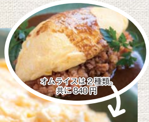
オムライスは2種類。共に840円