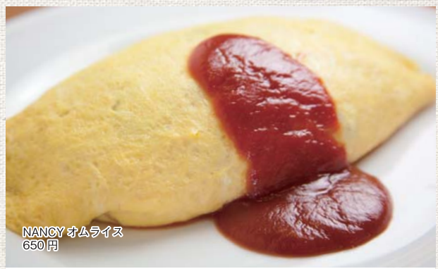
NANCY オムライス 650円