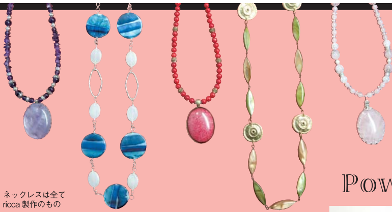
ネックレスは全て ricca 製作のもの