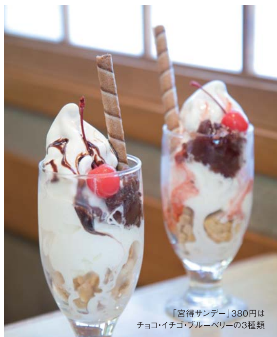
「宮得サンデー」380円は チョコ・イチゴ・ブルーベリーの3種類

菓匠 二宮 ☎0739-22-1001 田辺市下屋敷町27 AM8:30~PM6:00 定休日:水曜日