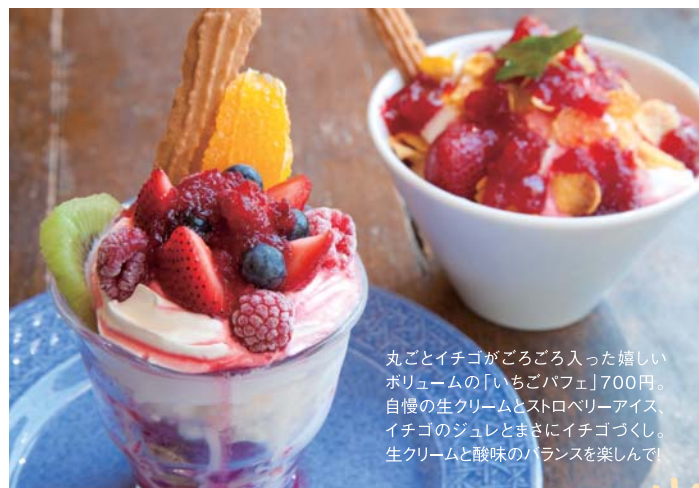
丸ごとイチゴがごろごろ入った嬉しいボリュームの「いちごパフェ」700円。自慢の生クリームとストロベリーアイス、イチゴのジュレとまさにイチゴづくし。生クリームと酸味のバランスを楽しんで！