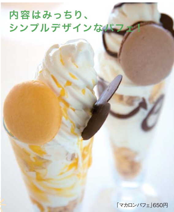
「マカロンパフェ」650円

マカロンがちょこんとつた「マサ」のパフェは、何と言ってもアイスクリームの美味しさが抜群！とびきりのなめらかさは安定剤を使っていない証拠でもある。風味豊かなアイスの下にはサクサクのフレークにココナツのムラングをミックスして食感にアクセントをつけている。チョコ、マンゴー、イチゴ、抹茶、ブルーベリーの5種類で、ソースはすべて自家製。既製品は一切使用しない「マサ」ならではの美味しさがいっぱい！