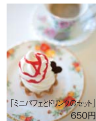
「ミニパフェとドリンクのセット」 650円

田辺市神島台1-21 AM10:00~PM8:00 (カフェコーナーはPM6:00迄) 定休日:水曜日