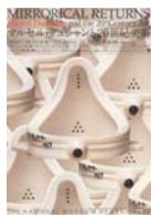
2004年大阪の中之島に国立美術館が移転した記念企画に「マルセルデュシャンと20世紀美術」が開催された。複製である「泉」をしばしば眺める様子がとてもユーモラスに感じました。