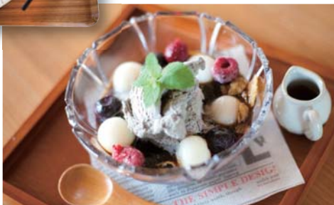
「和パフェ」380円。ほろ苦いコーヒーゼリー、ほうじ茶アイス、白玉、ベリーなどがたっぷり入ったデザート。