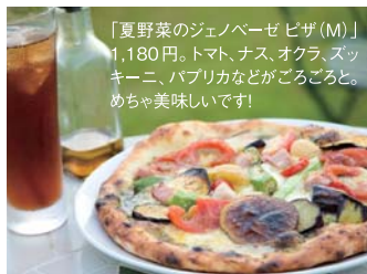
「夏野菜のジェノベーゼピザ(M)」 1,180円。トマト、ナス、オクラ、ズッキーニ、パプリカなどがごろごろと。めっちゃ美味しいです!

御坊インターのすぐ近くにある野菜レストラン。野菜ソムリエの資格をもつ店主は前職で果物や野菜の目利き兼バイヤーをしていたことから野菜にはちょっとうるさい。というより、より美味しく食べてもらうことにきちんと向き合っているという方が正しいかな。今や1年中トマトやナスがスーパーにならんでいるが、しっかり太陽の光を浴びた旬の野菜だけがもつ旨さや香りを大切にしながら料理を作るここでは、パスタもピザも他では味わえない美味しさ。県外からのゲストも多いが地元ファンも年々増加中。