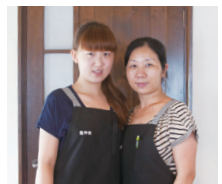
歩美さん・お母さん

上富田町岡642-7 AM11:00～PM2:00 PM4:30～PM11:00(LO PM10:30) 休:月曜日